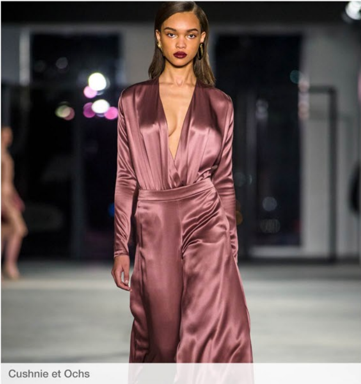
Cushnie et Ochs