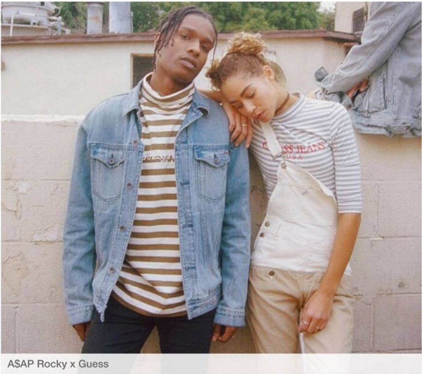
ASAP Rocky x Guess