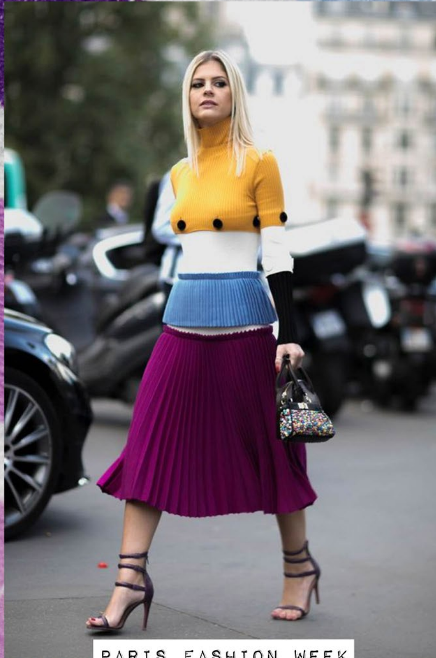
PARIS FASHION WEEK STREET STYLE