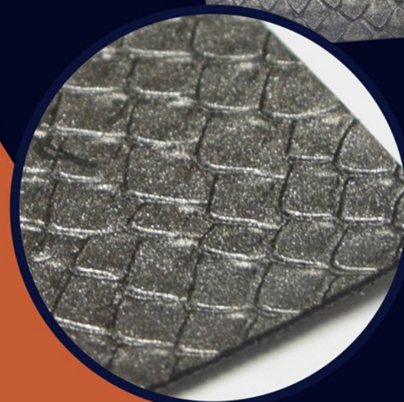
ANIMAL PRINT METÁLICO