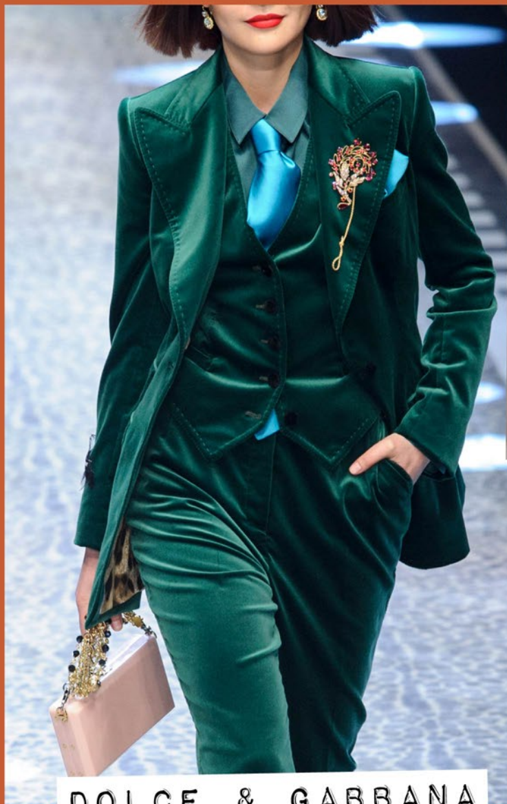
DOLCE & GABBANA