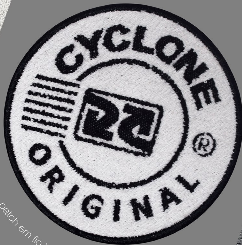
patch em fio bouclé com bordado periférico